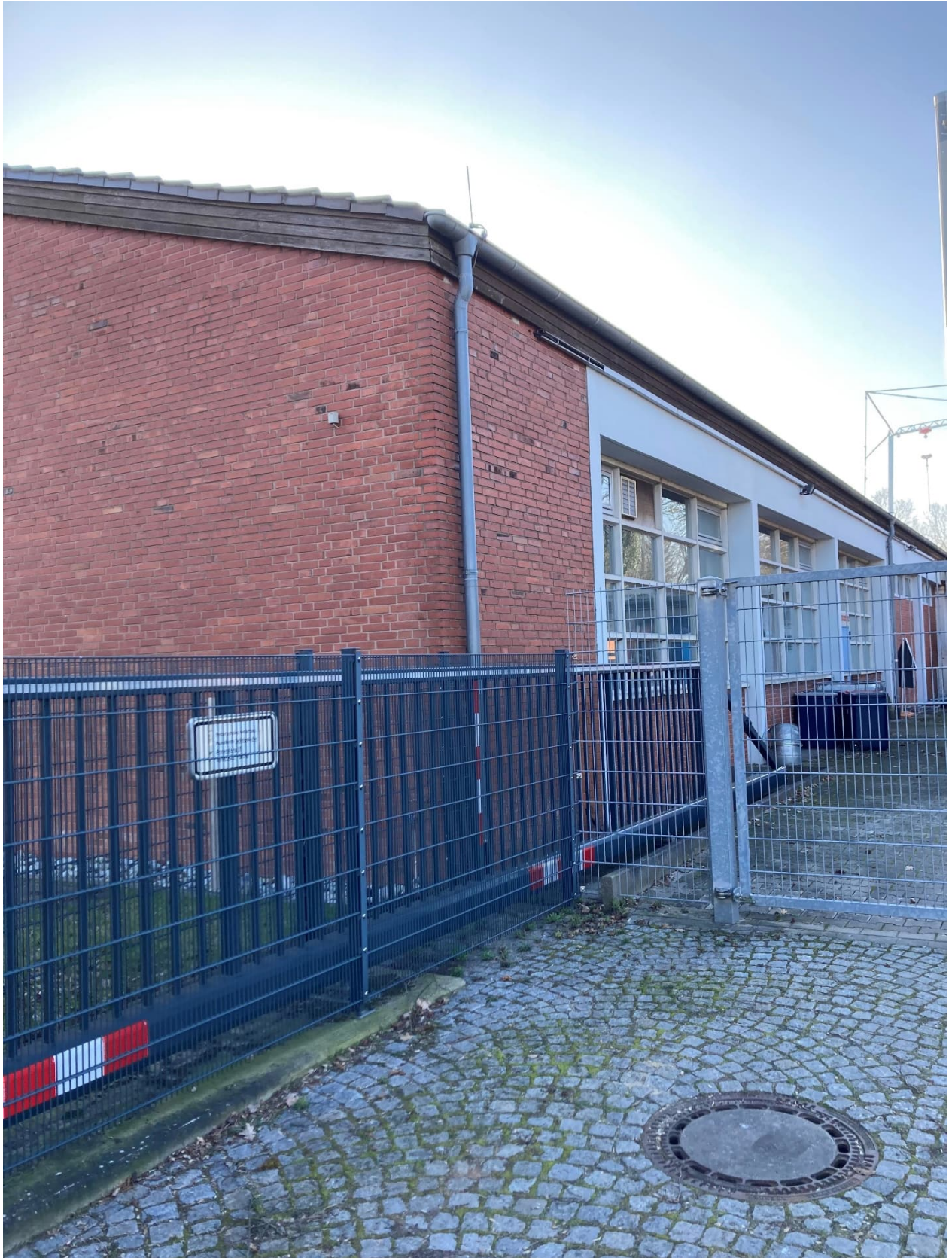
Abb. 3: Einfahrtstor Feuerstiege 16