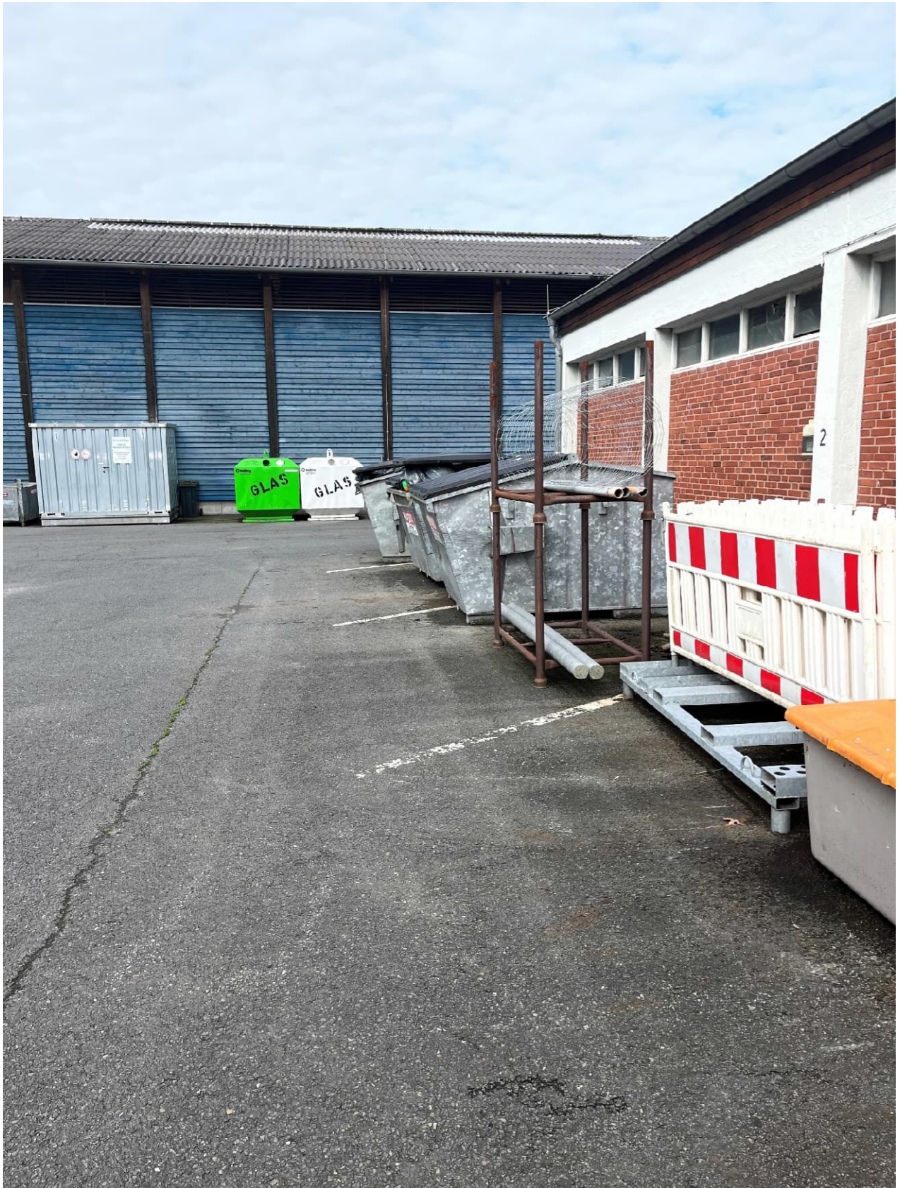
Abb. 15: SGH von Osten, rechts Lagerhalle Rückseite