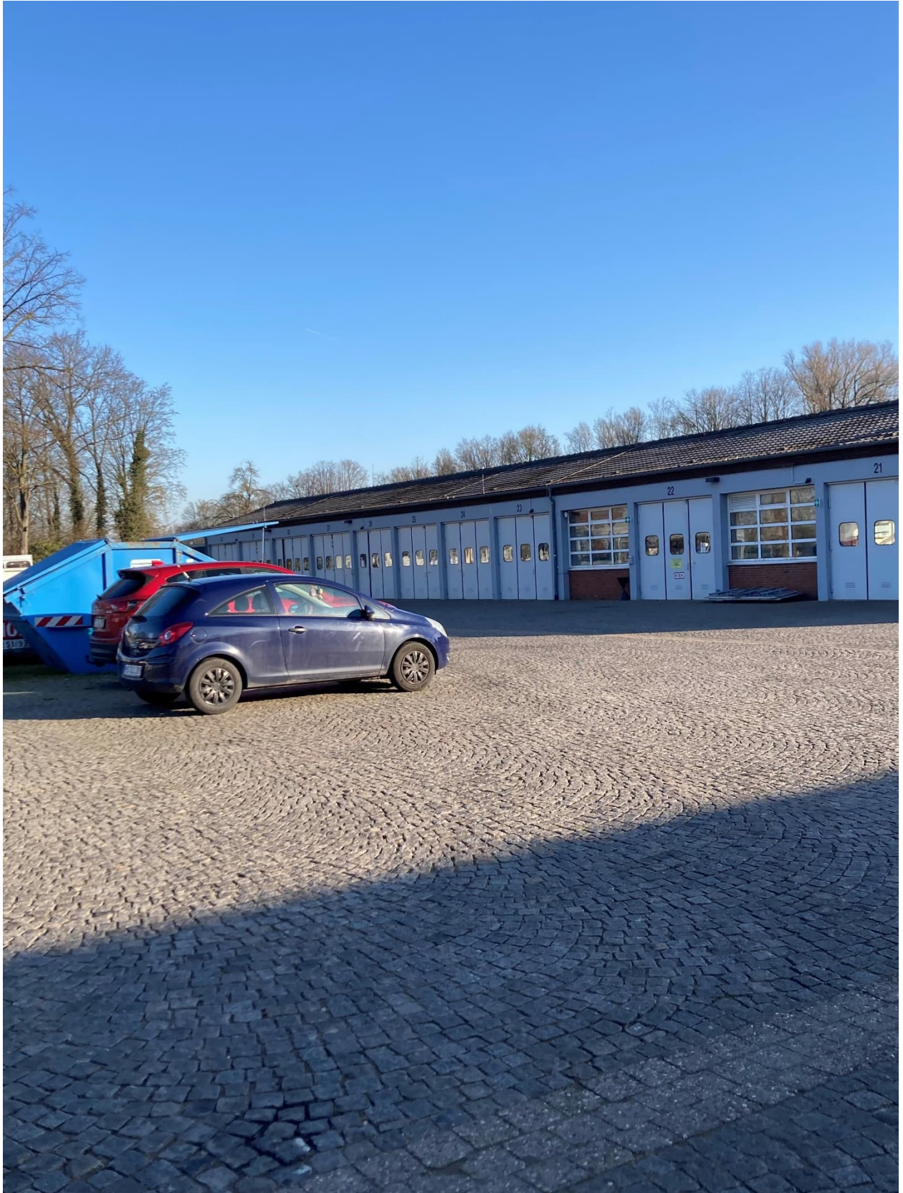
Abb. 6: Garagengebäude