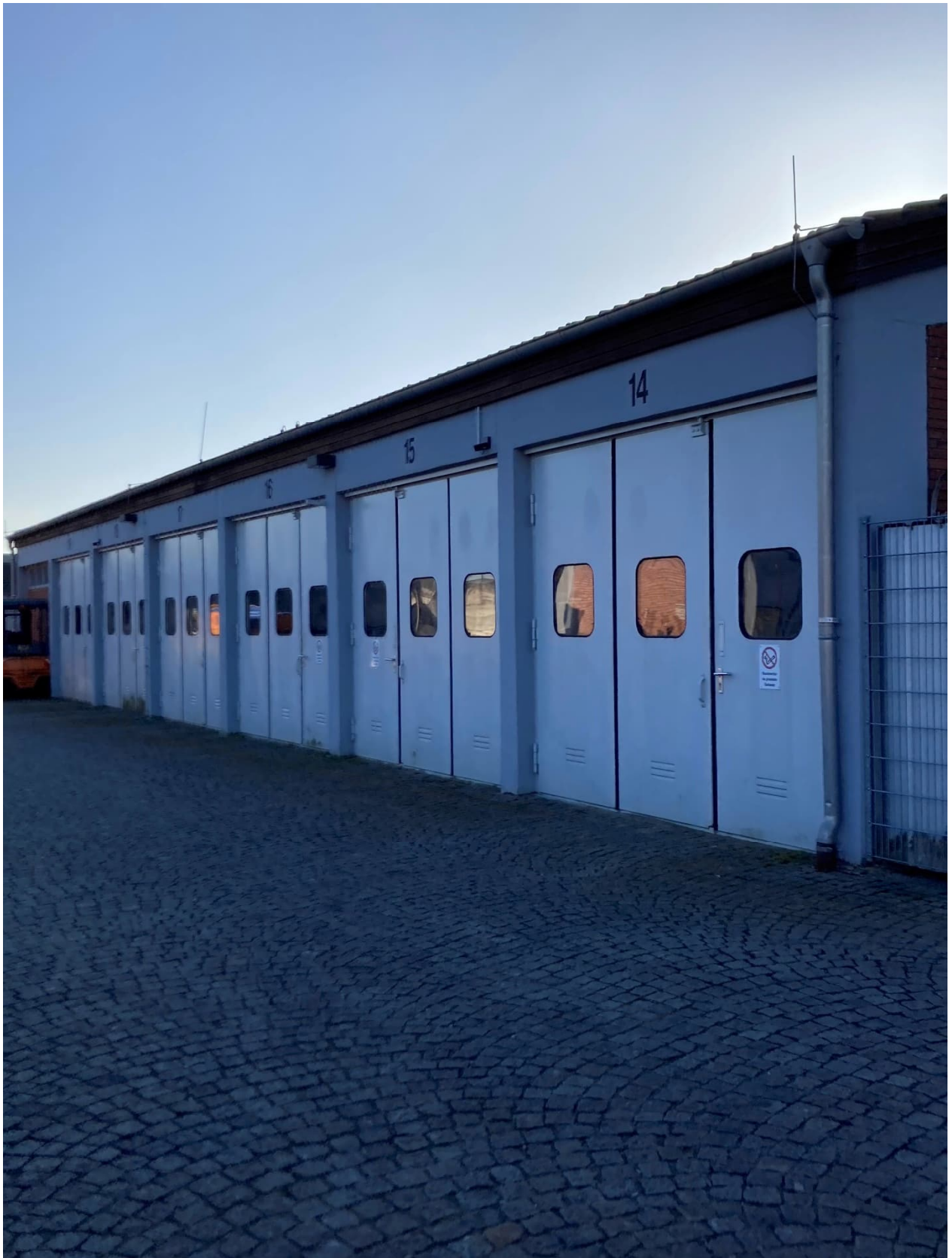
Abb. 11: Lagerhalle