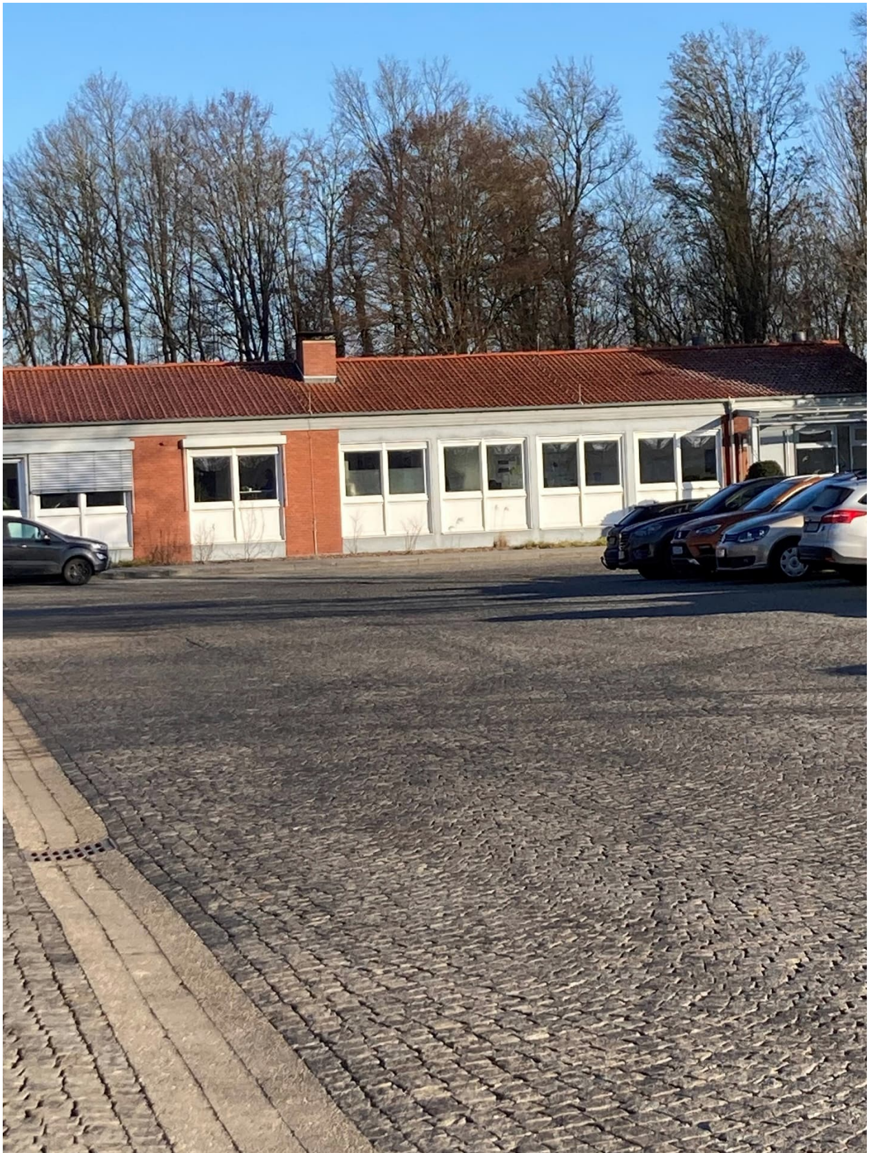
Abb. 4: Betriebsdienstgebäude