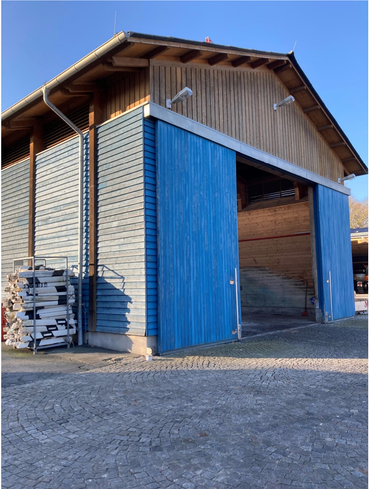
Abb. 13:Streuguthalle (SGH)