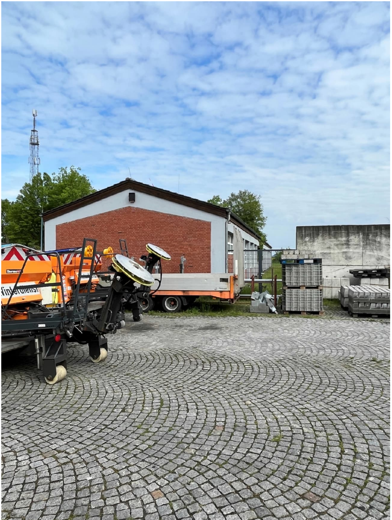
Abb. 9: Garagengebäude Blickrichtung Norden, Platz vor Lagerboxen