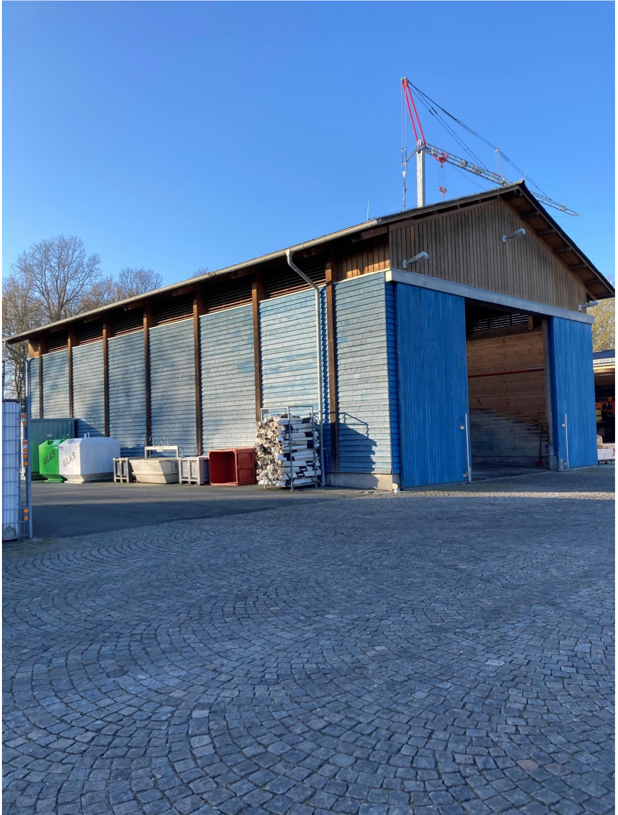
Abb. 14: SGH