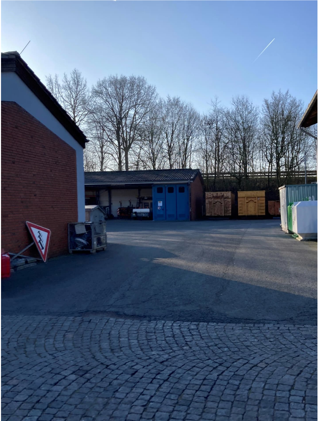
Abb. 12: Lagerhalle (links) Blick auf Remise (alt) am Südrand des Gehöfts, rechts SGH