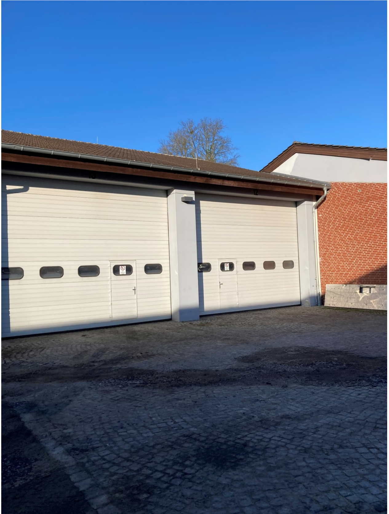
Abb. 17: Anbau der Kfz-Halle