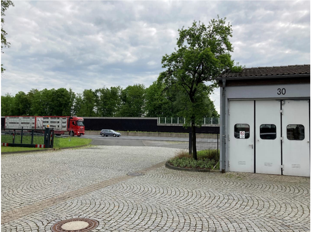
Abb. 5: Dienstzufahrt A1