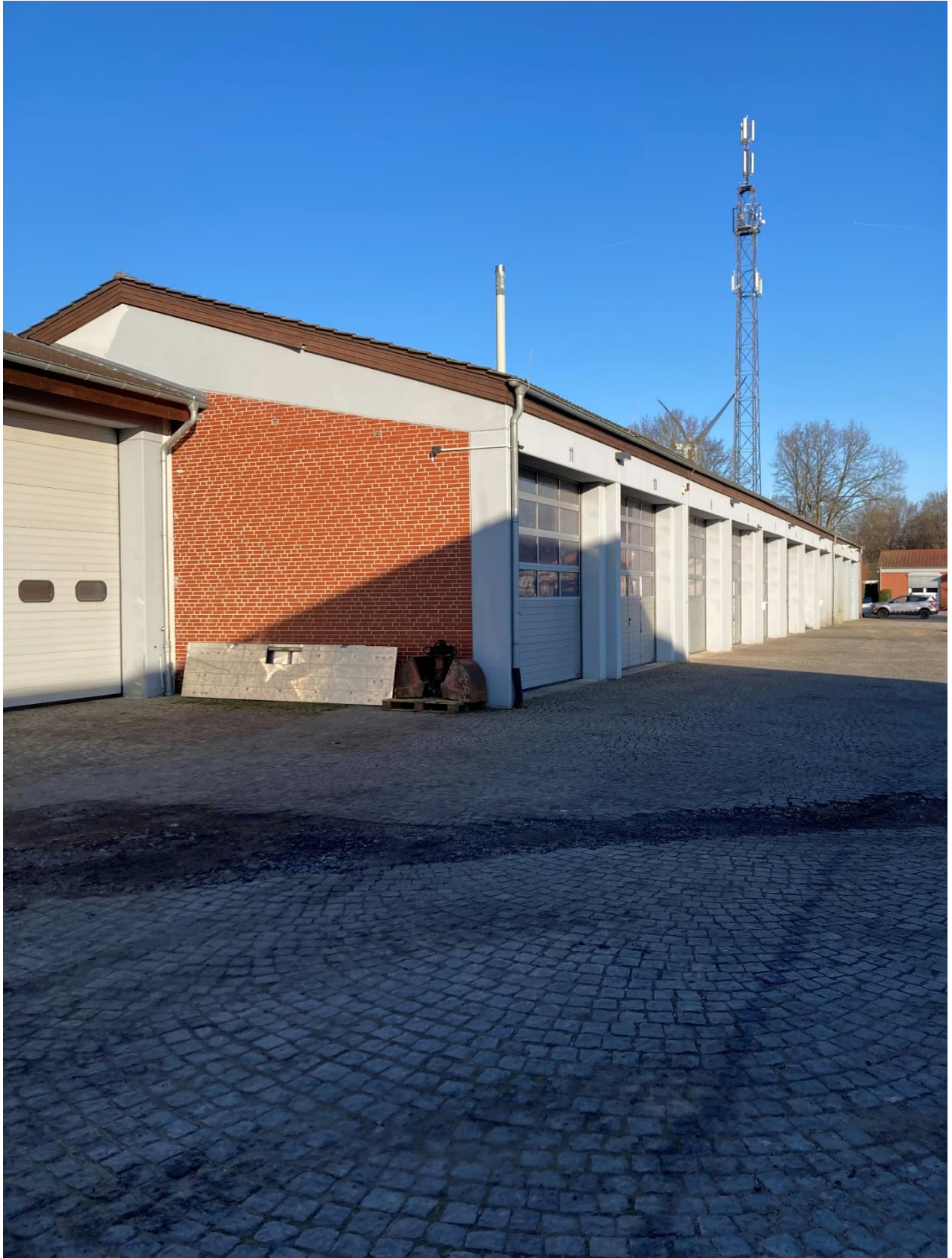
Abb. 18: Kfz Halle, hinten rechts Betriebsdienstgebäude