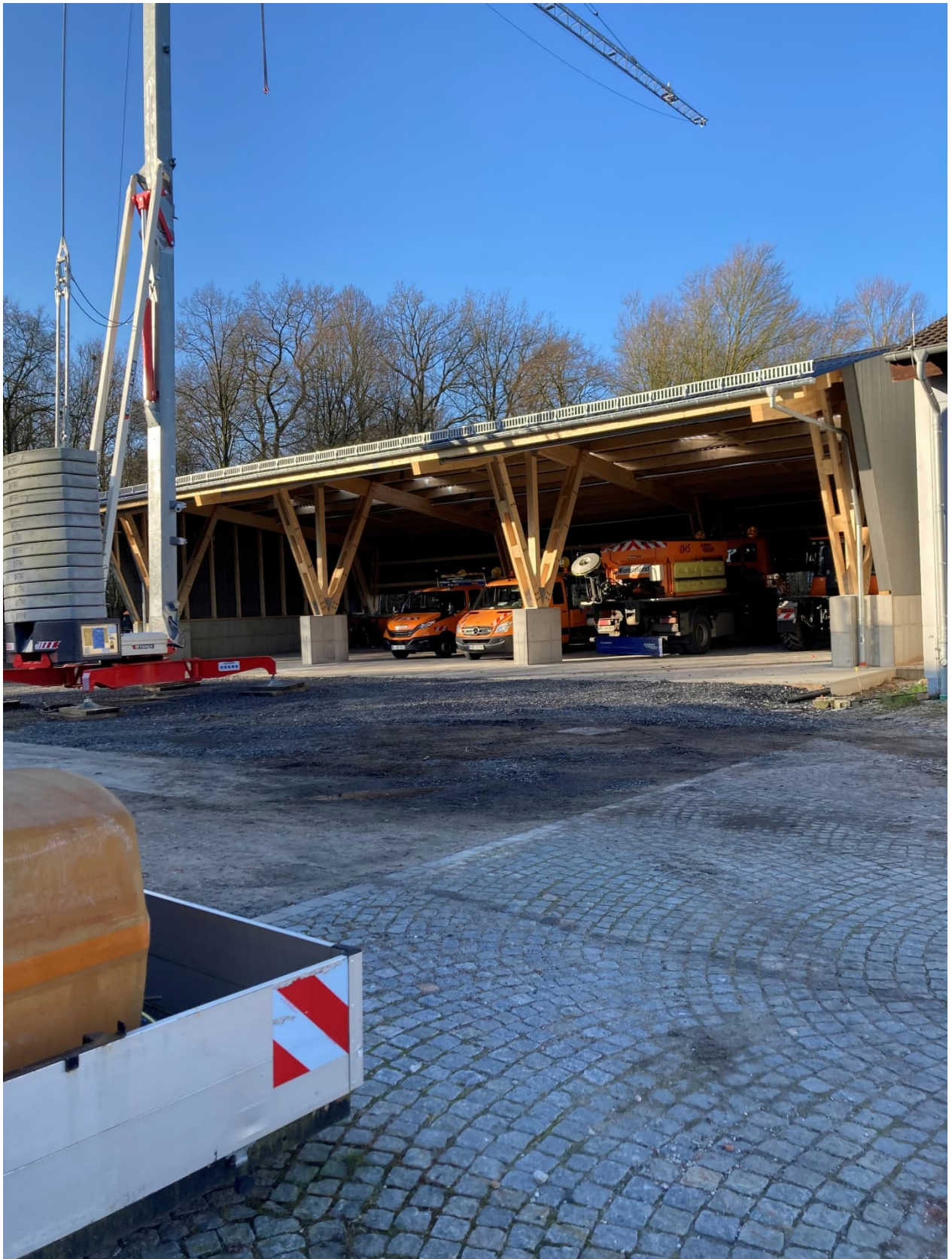
Abb. 16: Remise neu, Hier entsteht parallel eine Beton-Fahrplatte