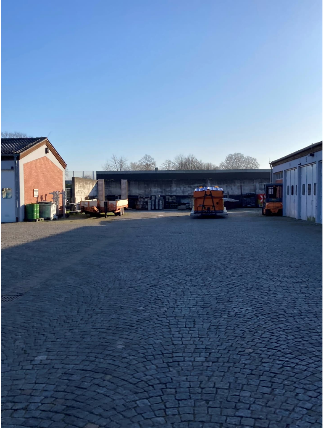
Abb. 8: Lagerboxen