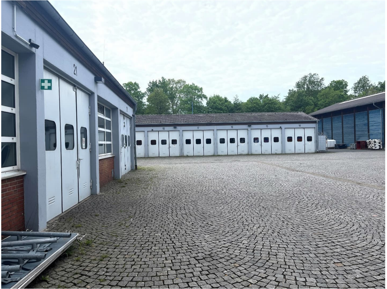
Abb. 10: Lagerhalle von Norden