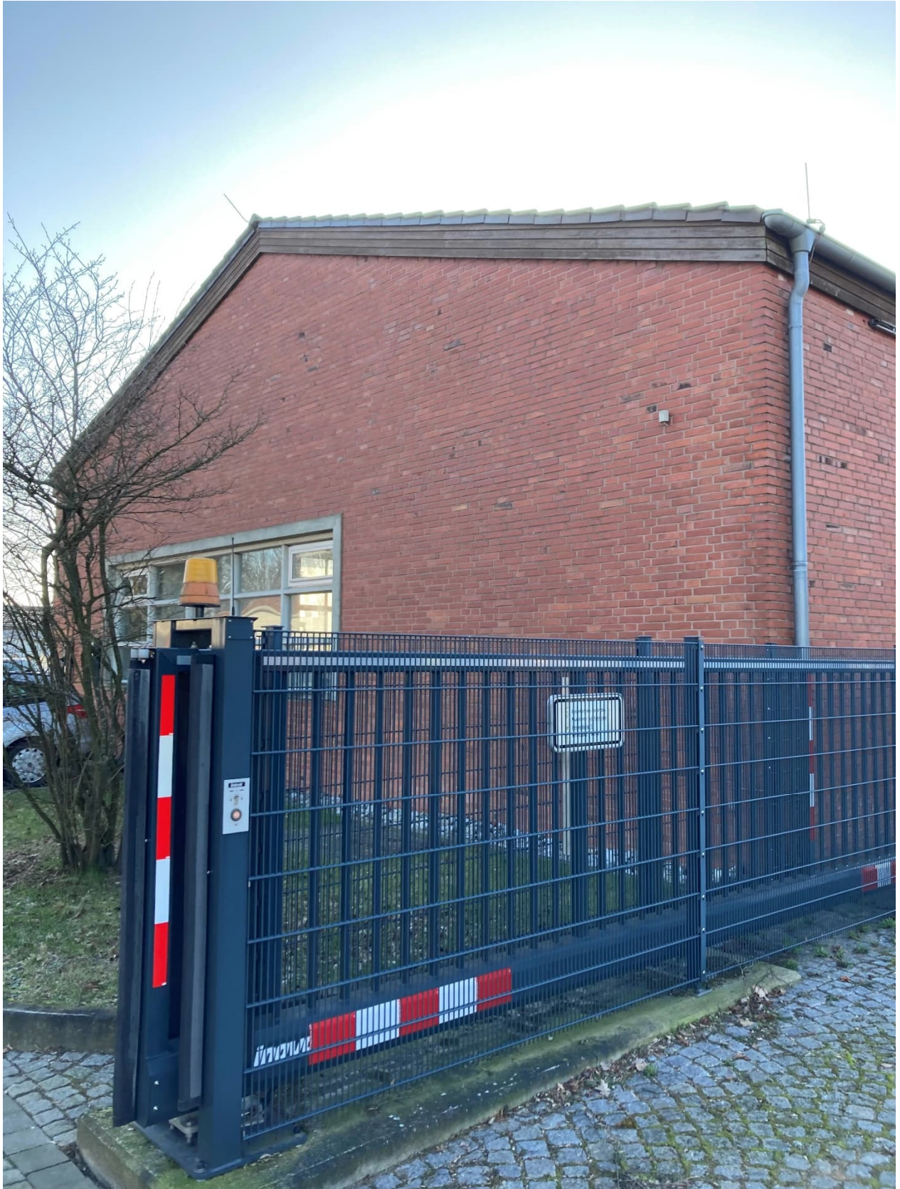
Abb. 2: Einfahrtstor Feuerstiege 16, Grünfläche wird Standort des neuen Schalthauses